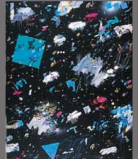
杉浦イッコウ《A SPACE ODYSSEY 86-V》1986年