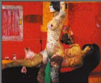
佐々木豊《十字形の構図》1991年

愛知県美術館所蔵作品展「戦後の日本画」 2009年7月7日(火)~8月30日(日) 展示室1・2