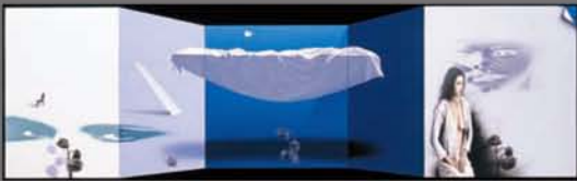
三尾公三《無限の風景》1989年