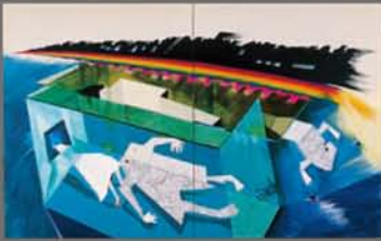
丹羽和子《記憶の中の街》1993年