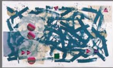
鏑本達朗《A trailing note 9111》1991年