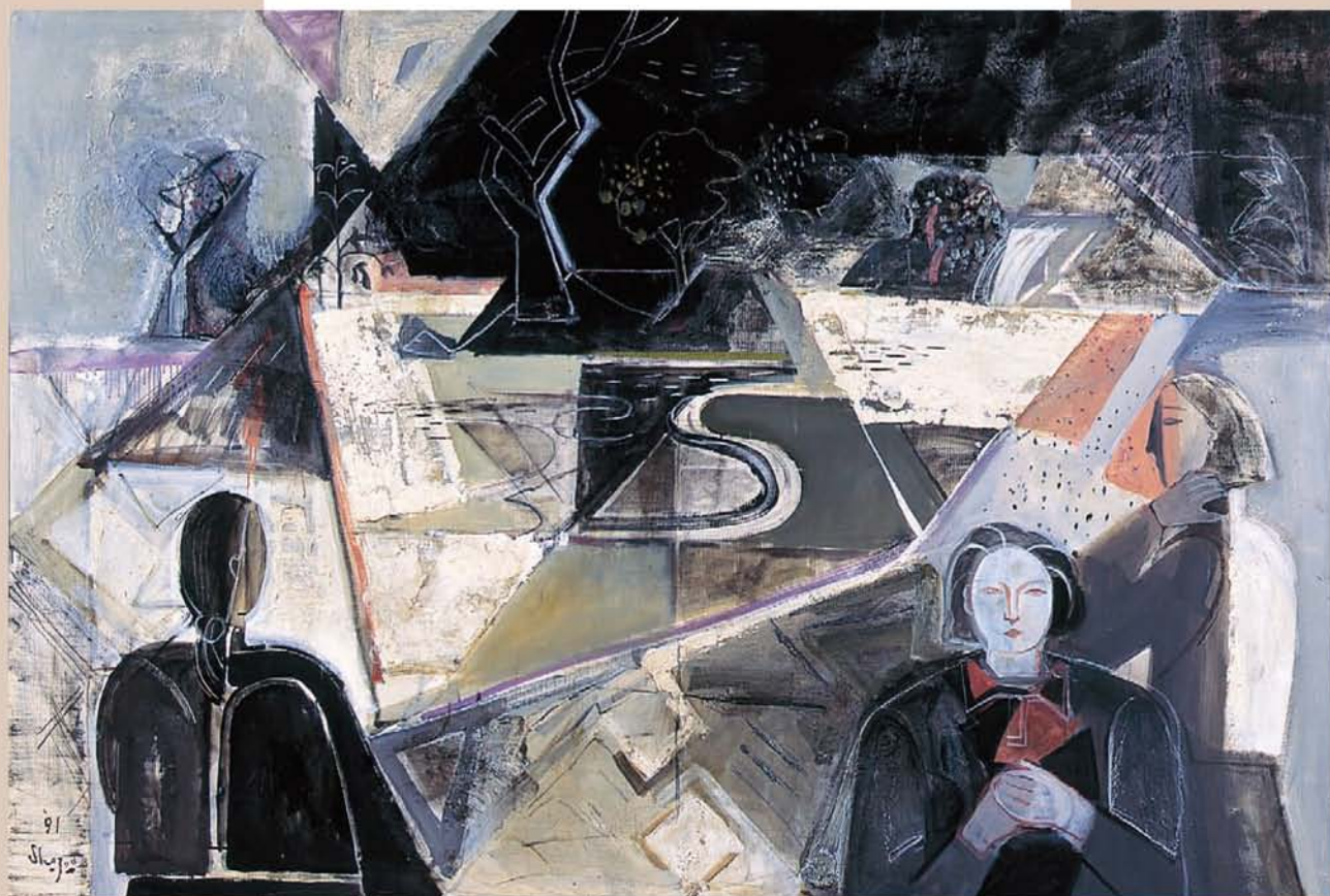
島田章三《池畔散策》1991年