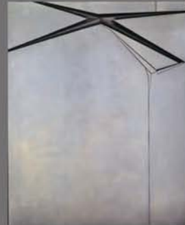
久野真《鋼鉄による作品#252》1974年