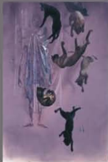
星野真吾《猫が落ちる》1985年