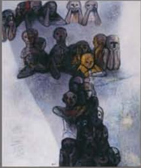
萩太郎《サーカス》1991年