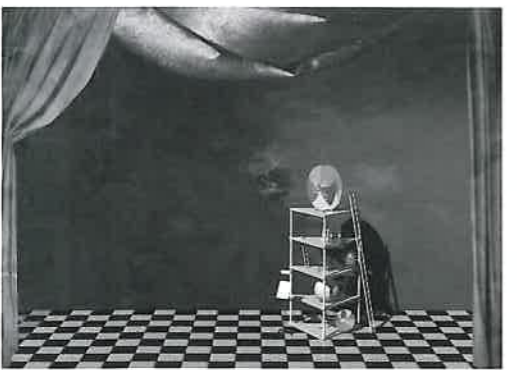
《on the stage IV》 綿布、墨、水干

谷崎綾子 (碧南市三宅町在住) 1983~1985 日本現代工芸美術東海会所属 1989~1992 日本画府所属 1989 個展 カフェ フォレスト (碧南) 第37回日府展 新人賞 (東京) 1990 個展 カフェ フォレスト (碧南) 1991 第38回日府展 奨励賞 (東京) 1991 個展 アトリエ (碧南) 国際工芸美術展入選 (東京) グループ展 アトリエ (碧南) 1994 個展 名古屋トヨペット碧南営業所 1995 個展 アトリエ (碧南) 個展 愛知トヨタ碧南店 2003 作品展 碧南市哲学たいげけん村無我苑