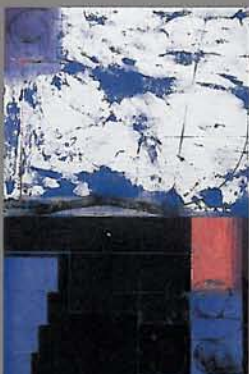
国島征二《Untitled Drawing 028-91》1991年