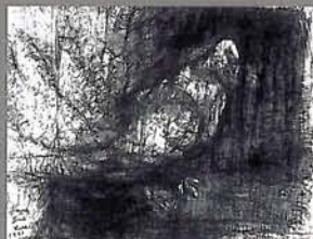
柳原義達《道標・鳩》1991年