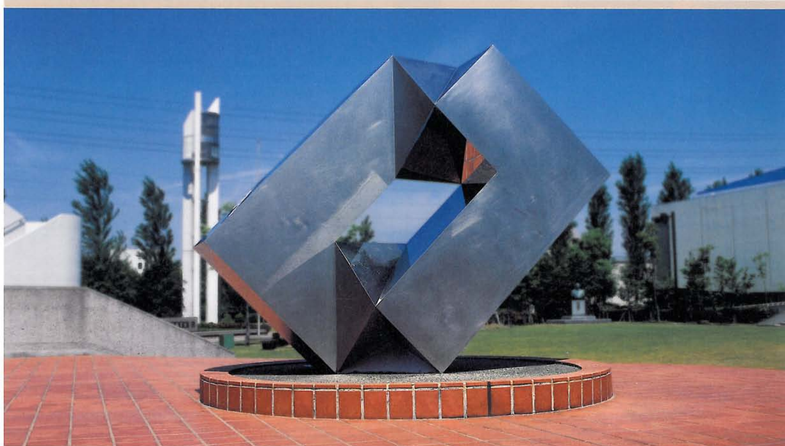
堀内正和《進む形》1983年