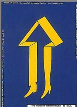
福田繁雄 《THE WORLD OF SHIGEO FUKUDA IN U.S.A.》 1971年