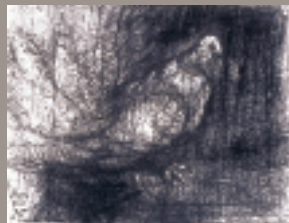
柳原義達《道標・鳩》1991年