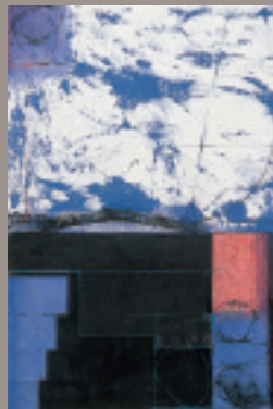
国島征二《Untitled Drawing 028-91》1991年