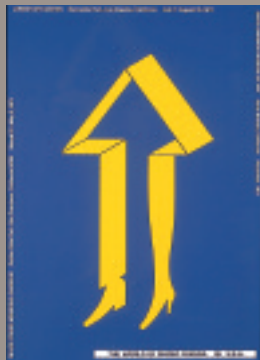
福田繁雄 《THE WORLD OF SHIGEO FUKUDA IN U.S.A.》 1971年