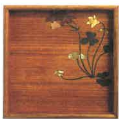
1.富岡鉄斎《古石長椿図》1912年【石川三碧コレクション】 2.毛利教武《手》1919年【平成26年度購入】 3.香月泰男《洗濯婦り》1963年【松本秀子コレクション】 4.三岸好太郎《桃と枇杷》1927年頃【松本秀子コレクション】 5.藤井達吉《草花文銘々盆(小)》1916年頃(10点組より)碧南商工会議所蔵【西郷健雄コレクション】 6.藤井達吉《草花文宝石箱》【都築咲子コレクション】 7.戸張孤雁《雁》1910年【平成27年度購入】 8.和田三造《花鳥園屏風》昭和初め(部分)【平成29年度購入】

碧南市藤井達吉現代美術館は2008(平成20)年4月5日の市制60周年記念日にオープンし、以来10年間、沢山の方々を支えられて活動を続けてきました。そのような有形無形の支えを代表するのがコレクション充実への理解といえるでしょう。碧南市には1990年代初頭の碧南市美術品購入審議会などを経て収集され、後に美術館へ移管された作品があります。また1983(昭和58)年から1995(平成7)年には「碧南の彫刻のあるまちづくり」事業が行われました。当地には文化的土壌が早くから存在したのです。そして当館の開館後は新たな収集方針の下、碧南市にふさわしいコレクション形成に一層努めるようになりました。収集方針は「(1) 藤井達吉の芸術を顕彰するのに重要と思われる作品、(2) 藤井達吉の精神を見出せる作家の作品、(3) 地域の歴史や文化を語る上で重要と思われる作家の作品、(4) 市民の美術文化の向上に資する作品、(5) 上記の作家や作品を理解する上で重要と思われる資料」からなり、収集候補作品は市民の代表者や有識者からなる美術館協議会に諮った上で収集されます。約1500点となったコレクションは碧南市民の貴重な財産であり、碧南市出身の美術工芸家、藤井達吉の作品や、フェウザン会出品者など藤井の同時代人の諸作品から、現代の美術までを含みます。このコレクションは2010(平成22)年度から始まった購入の他、寄贈・寄託によって少しずつ積み上げられてきたものですが、展示室面積の制約もあり、収蔵翌年の新収蔵品展を除くと展示機会が限られていました。そこで開館10周年を記念する本展では、集めた方のお名前を冠した収蔵品群である宮田二郎コレクション、山本牛介コレクション、内田浩子・善太郎コレクション、石川三碧コレクション、飯塚赫子コレクション、都築咲子コレクション、山中寛三コレクション、片山照子・繁コレクション、松本秀子コレクション、西郷健雄コレクション(碧南商工会議所より寄託)など、開館後の収蔵品を中心に全館を用いて展示します。さまざまな作品との再会をどうぞお楽しみください。