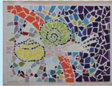
⑭ モザイクタイルアート