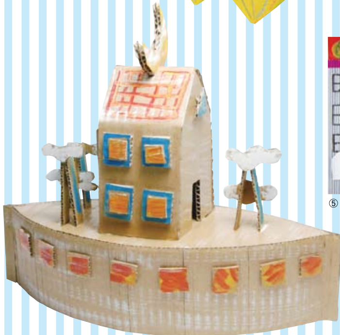
⑥ ダンボールアート