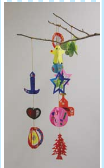
⑪ クリスマスマビール