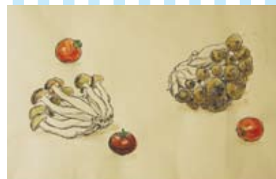
⑦ わりばしペんで描こう