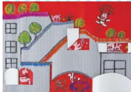
⑤ ぼくの家 わたしの家