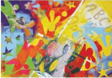
① ローラーコロコロ

●実施日／平成23年7月～12月 ●会場／地下1階 創作室 ※詳しくは、裏面および広報をご覧ください。 ※都合により内容を変更する場合があります。