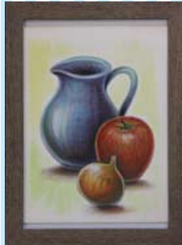
⑬ 水彩画で描く静物画