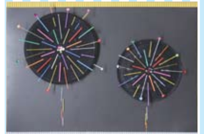
③ 貼り絵で花火を表現