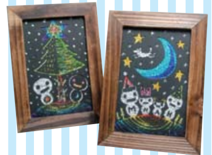
⑩ スクラッチのキラキラガラス絵