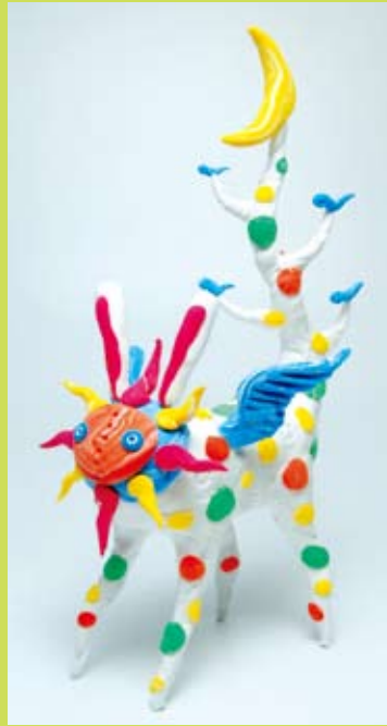
② 不思議な動物づくり