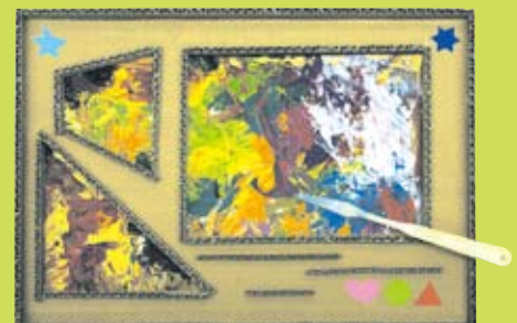
⑦ ペインティングナイフで描こう