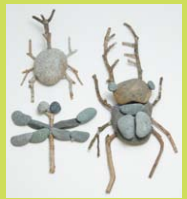
⑩ 自然素材のコラージュ ~枝と石ころの昆虫~