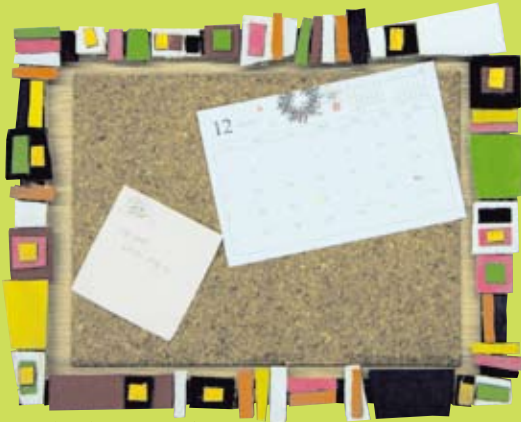
③ つぎはぎピンナップボード