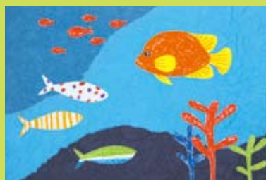
⑤ 和紙の継紙技法に挑戦