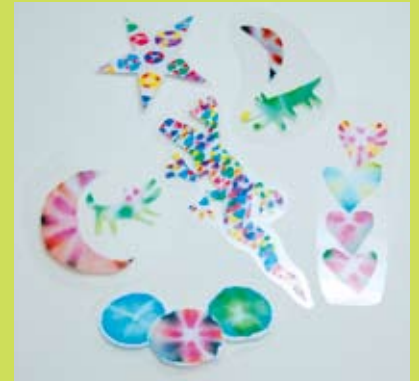
⑫ にじみ絵のしおり作り