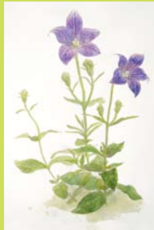
⑨ 水彩絵の具で植物を描こう