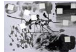
⑭ 抽象表現入門～墨で遊ぼう～