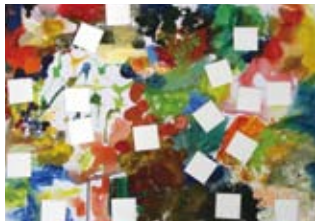
① 抽象表現入門～絵の具で遊ぼう～