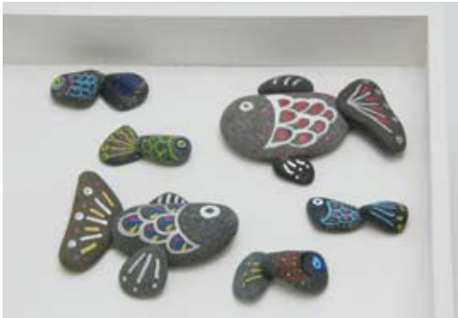
⑮ 自然素材のコラージュ《石ころ水族館》