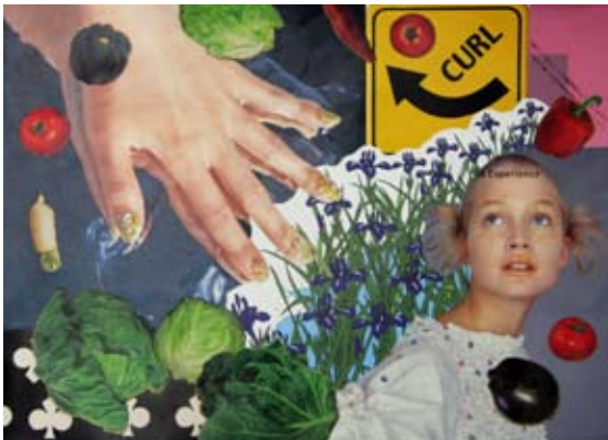
③ コラージュで自由に表現