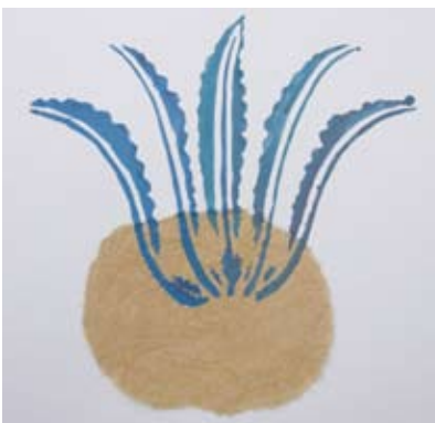
⑧ 達吉図案で遊ぼう