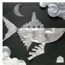
⑥ アルミニウムで 金属レリーフ