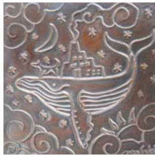
⑨ 銅のいぶしレリーフ