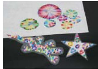
② にじみ絵で花を咲かそう