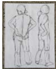
⑪ みんなでクロッキー大会