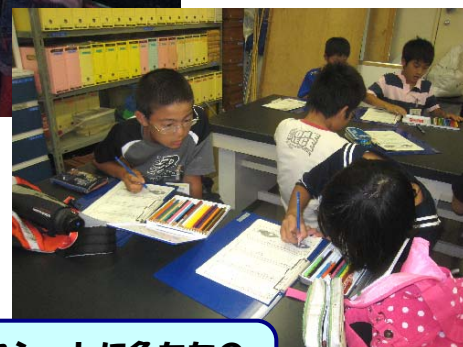
ワークシートに魚たちの様子を 書き込みました。