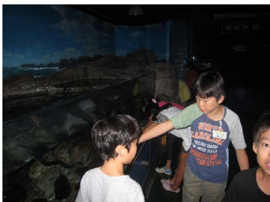
水族館の生き物は、夜のどんな行動をしているかな。