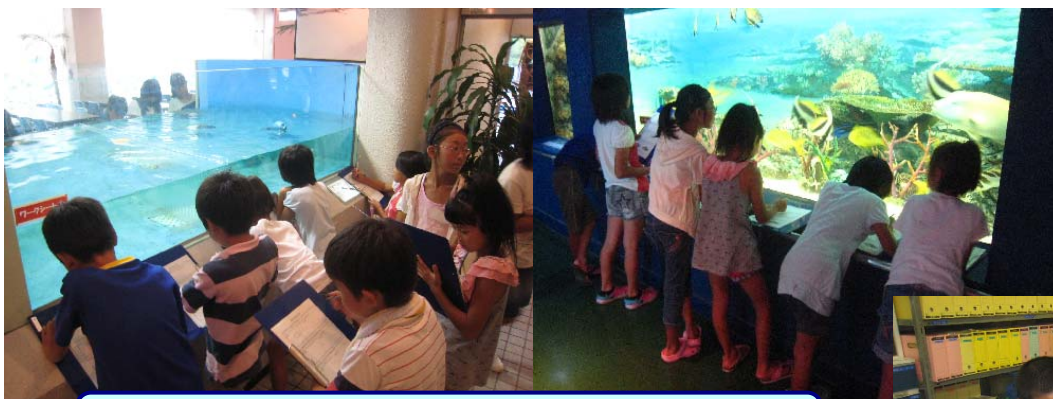
明るいときの生き物の様子を観察しています

スケジュール：昼間の水族館の観察→水族館の消灯 →休憩→実験・ゲーム→夜の水族館 の観察→まとめ