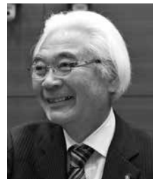
想政会 新美 交陽