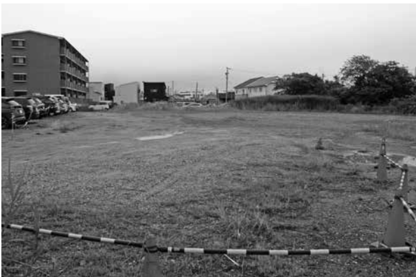
▲碧南駅西の旧亀島織布跡地

答 碧南駅西の「旧亀島織布跡地」を有力な候補地と考えながら、建設用地の選定に努める。