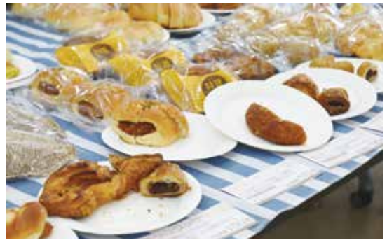
▲試食用焼きたてパン

碧南市民病院では、旧コンビニエンスストア撤退後のスペースに新売店を設置するとともに、周辺スペースを含め一体感を持ったデザイン性のあるアメニティスペースとして再構築する工事を行いました。翌日の開店に先立ち、売店の内覧と店内ベーカーリーで作った焼き立てパンを試食する機会が設けられ、碧南市議会議員も参加しました。