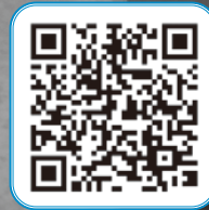
▲碧南市議会中継への2次元コード