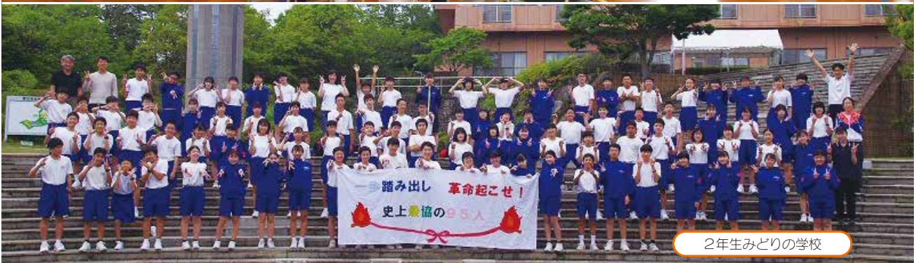
2年生みどりの学校