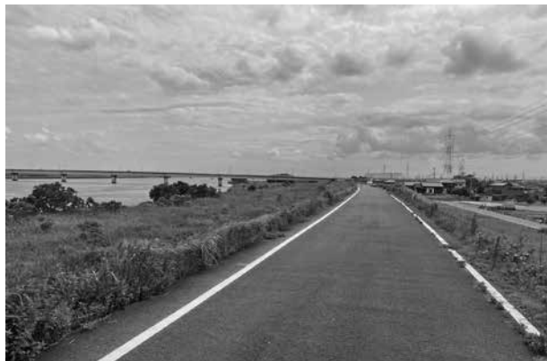
▲早期開通が望まれる矢作川堤防道路

答 中畑橋及び柵尾橋との交差点の改築等に係る協議において、問題点の指摘があり進展がない状況であったが、今後は令和5