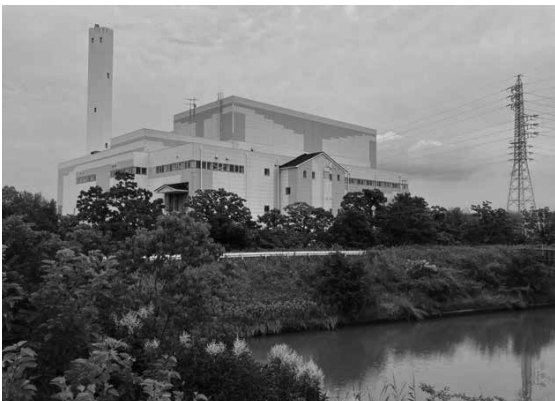
▲クリーンセンター衣浦

問 更地化が進んでいる宮下住宅吹上町側の建設計画を今後具体化し、国の補助申請を。省エネ再エネ導入の若い世帯も入居できる住宅建設を求め。 答 30戸から40戸を計画しているが時期は今後検討する。