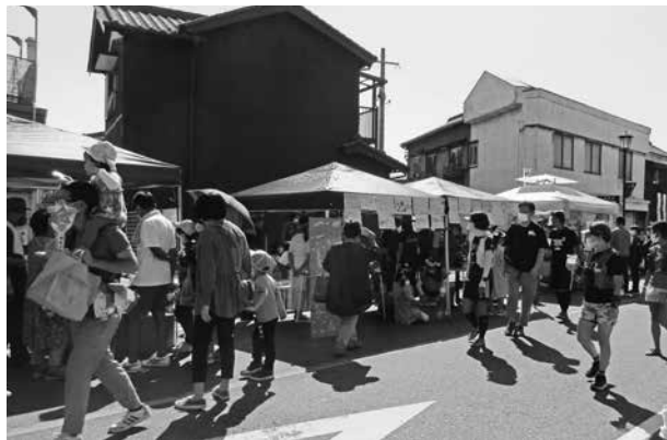
▲昨年度の大浜てらまちウォーキング

答 実行委員会前のため、まだ何も決まっていないが、市制75周年をPRするイルミネーション