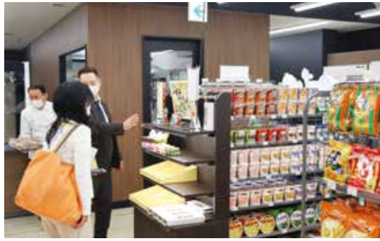
▲碧南市民病院の新しい売店