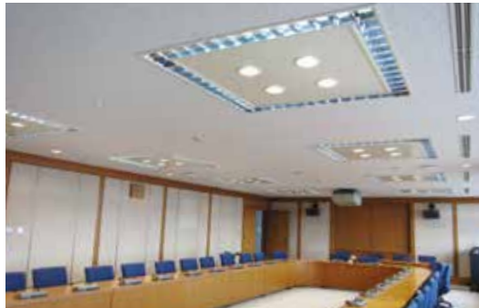
▲LED化された議員大会議室の様子