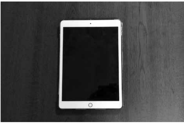
▲知識を得るのに便利なタブレット端末

答 好きな場所で利用でき、文字が見やすいメリットもあるので、導入を前向きに検討する。