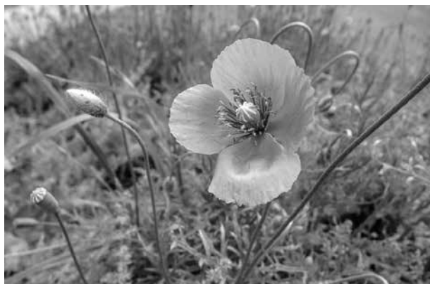
▲最近繁殖が多く見られる「ナガミヒナゲシ」