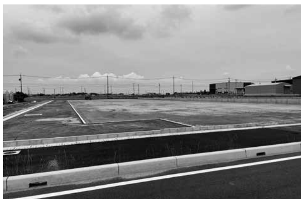
▲下水道敷設が必要な北部工業用地

答 市の勧告を受けると固定資産税の特例が解除になる。適正管理の促進、空家除去費補助等により空き家の減少を図りたい。