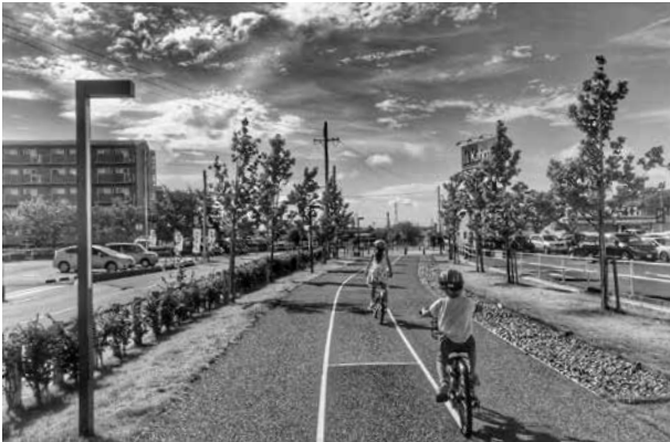
▲自転車乗車時のヘルメット着用努力義務

答 施設の故障箇所は認識しているが、予算の都合上、優先順位を設けて順に対応している。