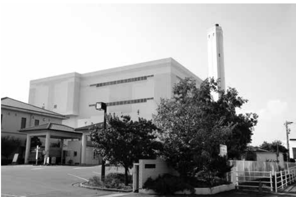
▲クリーンセンター衣浦