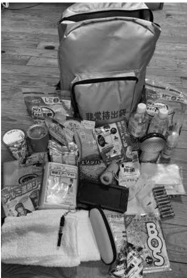
▲家庭で備えたい災害用持ち出し袋

付が受けられる。申請が困難な方は代理で申請でき、経過措置として、保険者が必要と認めた場合、申請によらず職権で交付できる旨の規定も設けられる。