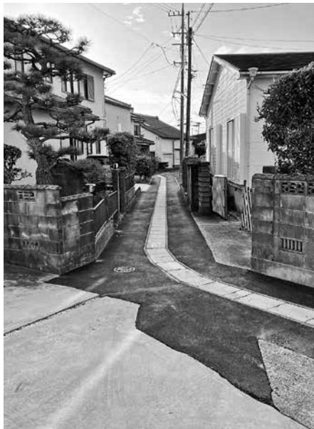
▲狭あい道路(幅員4m未満)