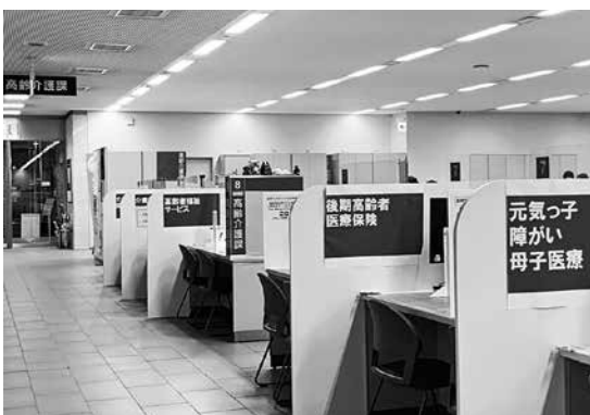
▲多くの来談者が訪れる市役所各課の窓口

答 令和8年度より、既存の各課の窓口で、専門外の相談にも断らず全て受け止め、寄り添う「重層的支援体制」の構築を行い、来談者の不安解消に努める。