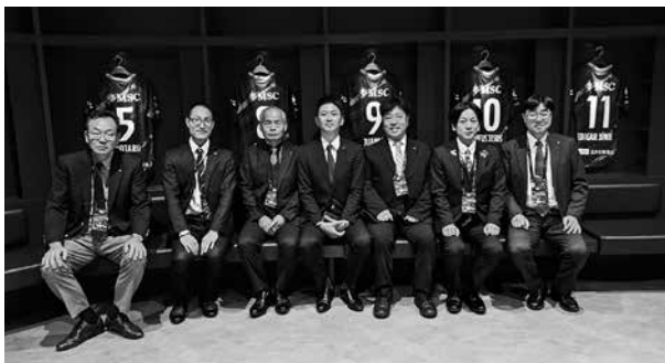
▲長崎スタジアムシティ

長崎スタジアムシティプロジェクトは民間企業が事業主体となりスタジアムとアリーナを含む複合開発を推進し、長崎県及び長崎市は、協議会や検討推進チームを組織してプロジェクトをサポートしている。スタジアムの観客席は約2万席でアリーナの観客席は約5000席であり、付帯施設として商業オフィス、ホテル、駐車場や飲食店、販売店等がある。維持管理・運営も民間企業が行い、民間活力が最大限生かされている。