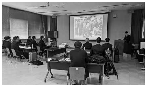
▲知覧特攻平和会館

知覧特攻平和会館は太平洋戦争末期、沖繩戦において人類史上類のない特攻作戦で亡くなられた陸軍特別攻撃隊員の遺品や関係資料等を収集保存展示し、その記録を後世に残し、またその史実をとおり「二度と悲惨な戦争を起こしてはならない」という平和のメッセージを発信し、平和の大切さ、命の尊さを語りつぎ、世界恒久の平和に寄与することを目的に建設された。館内の語り部が修学旅行や一般団体等に戦争の悲惨さ・平和のありがたさ・命の尊さ等について説明・案内し、毎年8月15日には、平和のスピリットコンテストを開催している。戦争体験者が少なくなる中、事実を伝えていくための日々の地道な調査が欠かせない。