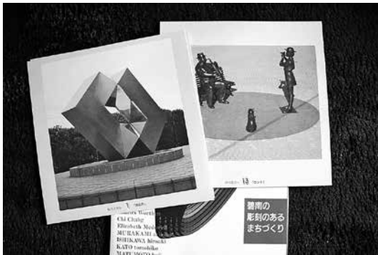
▲碧南市彫刻のあるまちづくり

答 市内小中学生を対象に「野外彫刻絵画コンテスト」を実施、SNSや市ホームページ等で積極的に情報発信し周知したい。