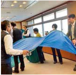
◆市議会防災訓練の様子

有事の際、迅速に対応できるようにするため、避難所用テントとエアベッドを設置・撤去する訓練を行いました。組み立て作業の手軽さを確認するとともに居住空間の広さやプライバシーの配慮について確認しました。