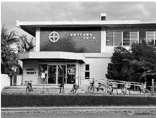
▲碧南市民図書館中部分館