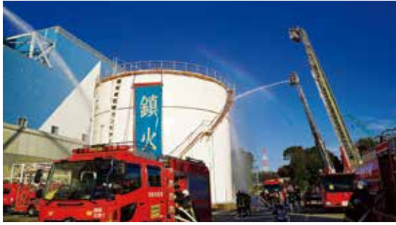
▲石油コンビナート等防災訓練の様子

愛知県及び碧南市の主催により、愛知県石油コンビナート等防災訓練が(株)JERA碧南火力発電所及びその周辺海域で行われました。議長始め議員も防災訓練に参加しました。