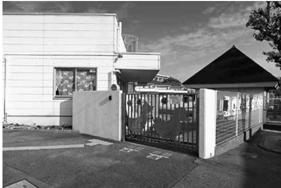
▲児童発達支援の総合拠点予定地の大浜幼稚園

答 早急に解決すべき課題の一つである。令和10年度に(仮)伊勢町認定こども園が開園予定であり、同時に空き施設となる大浜幼稚園を児童発達支援の総合拠点とし、医療的ケア児の受け入れも視野に入れた児童発達支援事業所の整備を行う予定。