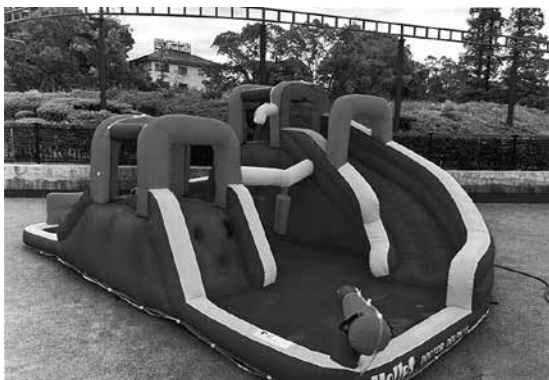
▲明石公園の滑り台付き仮設プール

答 これまであおいパーク、明石公園、水族館と相互割引による利用促進に取り組んできたことに加え、今年度は美術館との相互利用を目的としたスタンプラリーを実施した。今後も臨海部の人の流れを意識した集客、誘客の取り組みを検討していく。