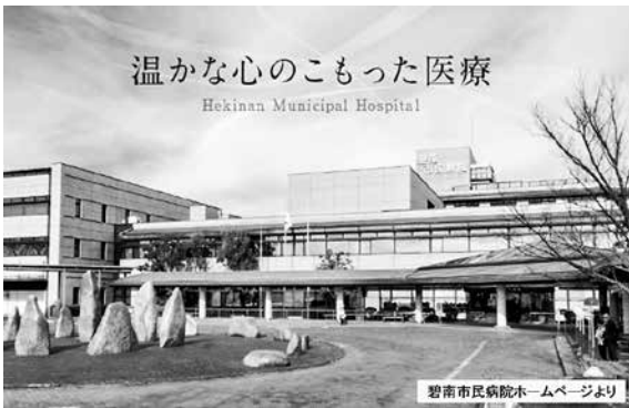
▲早期に経営改善が望まれる碧南市民病院