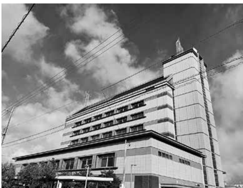
▲財政非常事態宣言発出中の碧南市

問 無料お風呂券の廃止は、健康長寿の観点から反対だがどうなるか。また高齢者元氣ツス館浴室利用者カードはどうなるか。 答 高齢者及び障害者の入浴サービス事業については、お風呂券を廃止し、低料金で利用できるように改めたい。利用者カードは今まで通りと考えている。