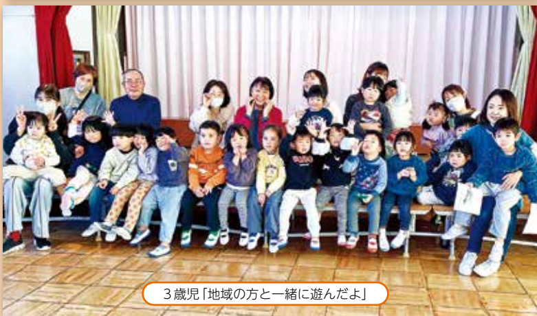
3歳児「地域の方と一緒に遊んだよ」