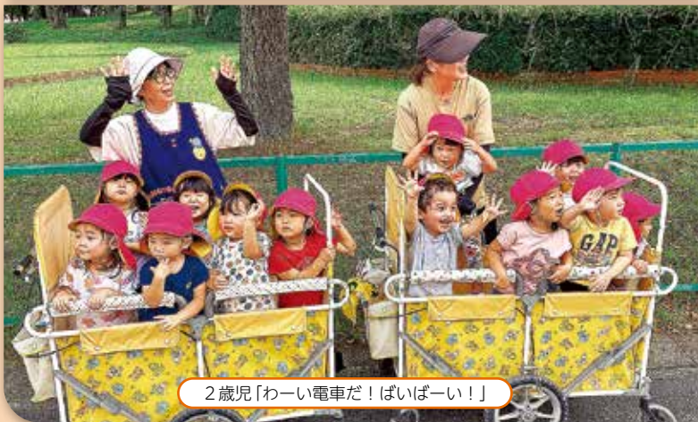
2歳児「わーい電車だ！ばいばーい！」