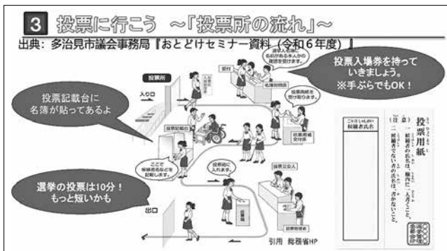
▲投票率向上対策(多治見市議会より)

答 参政権は憲法で国民固有の権利と規定され、公職選挙法及び判例も日本国民に限るとしている。本市としては独自見解を持たず、憲法・法令・判例に基づき適切に選挙事務を執行していく。