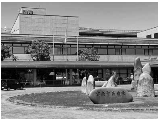
▲経営改善が急務な碧南市民病院

答 豊かな自然環境とものづくりが盛んであると認識している。必要な投資を継続して実施し、雇用環境の拡大に努める。魅力ある公共施設を全国に発信する。