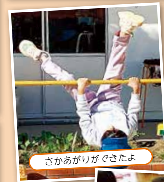
さかあがりができるよ