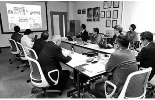
▲グリーンフィル小坂(株)

最終処分場のグリーンフィル小坂(株)とその親会社であるDOW Aエコシステム(株)は令和元年から、衣浦衛生組合で発生した焼却灰を受け入れて頂いている事業者で、今回初めて碧南市議会を訪れ、今後の説明と現地確認をした。現在利用している武豊のアセックから、7、8年の網掛けと利用規制が通告され、今後の対応に苦慮する中、大切な最終処分場である。従来の処分場よりも広大な敷地で、放流水の基準も厳しく実施されていた。