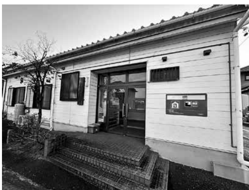
▲鴻島町にある防災の家

答 未修繕の空き部屋がある場合に、現状のまま貸しており、鍵交換や照明の設置などの対応をする予定はないが、住宅に付帯する施設が破損しており、使用ができない状況であれば、必要な修繕等を行う。