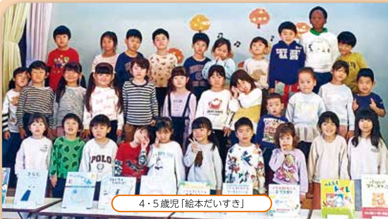
4・5歳児「絵本だいすき」