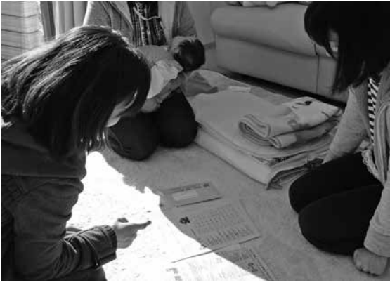
▲伴走型母子支援の様子

答 市では保健師、母子保健推進員が妊婦・子育て世帯に訪問、相談を行い、支援の充実を図っている。導入は考えていない。