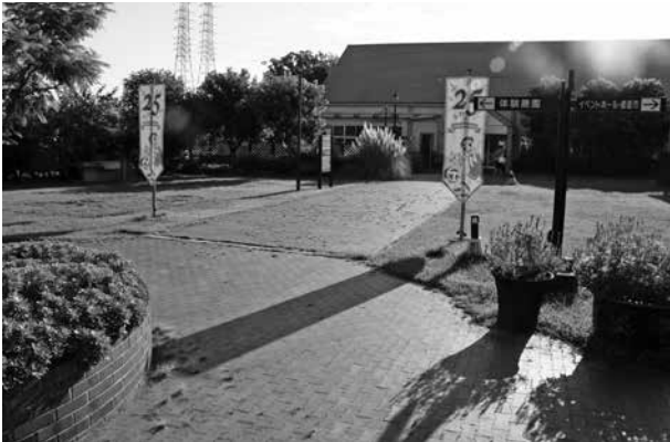
▲出店のスペースに適した中庭

答 既存施設との競合や関係者との調整が必要であり、今後、影響や効果等について研究していく。