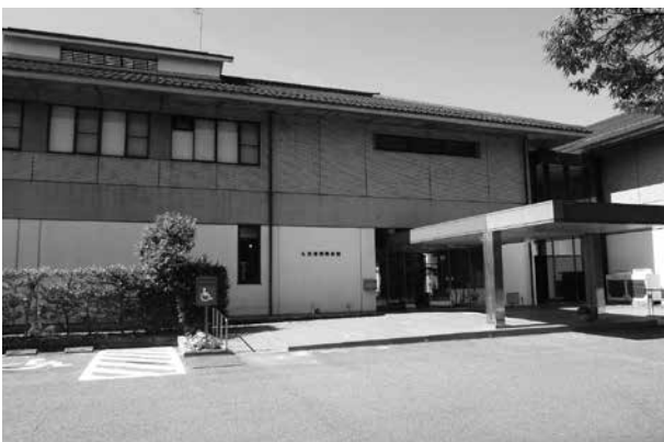
▲開館以来40年が経過した衣浦港湾会館

答 令和4年度は一般会計からの1595万円余の運営補助金の実質的な赤字である。令和5年度も運営補助金として1800万円を計上し、2008万円