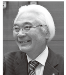
想政会 新美 交陽

答 リニューアル記念展は所蔵作品展として過去最高5689人の方が来場。開館以降の延べ観覧者数は、79万4千人。