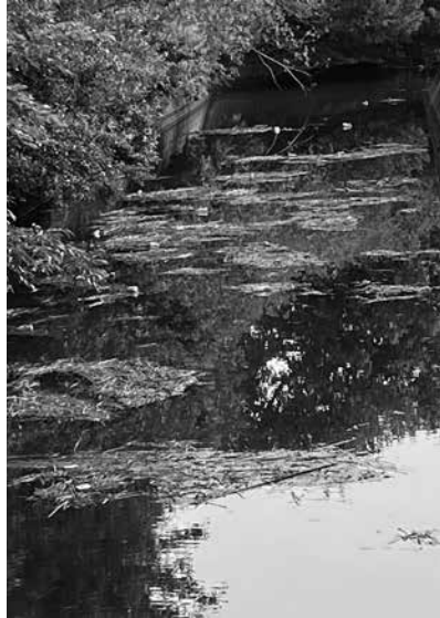
▲強風後の臨海公園公有水面

問 大浜上区、中区から公有水面のヘドロ及びゴミを撤去し美化、樹木を剪定するなど適正に維持管理、2026年アジ