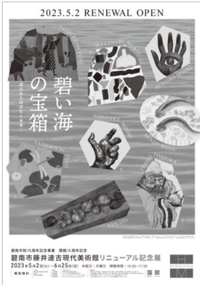
▲リニューアル記念展「碧い海の宝箱」

サイトを設け、誰もが気軽にまちづくりに参加できる協働の仕組みを軌道に乗せることで、地域の課題解決や地域コミュニティ活動につなげるという将来構想を持っている。