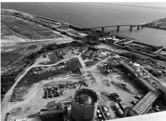
▲JERAのアンモニアタンク

答 保健室に常備。養護教諭が体調確認や悩み相談に乗る良い機会として今後も継続する。