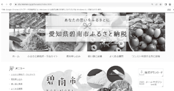
▲碧南市ふるさと納税ホームページ

答 ワンストップ特例申請書や確定申告に必要な寄附金受領証明書等の発送、人件費など、今回新たに対象経費となり、経費が52・5%になる。そのため返礼品ごとの寄附金額を上げるなど