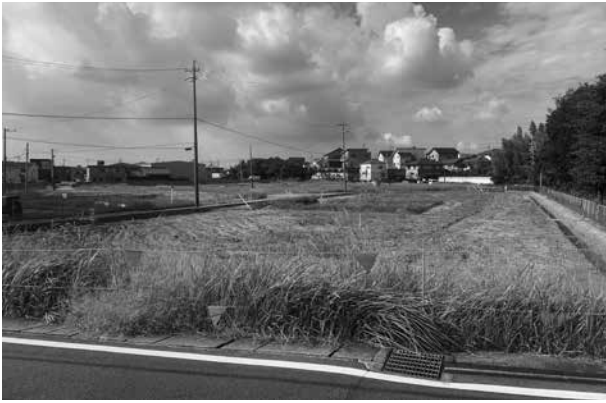
▲解体工事が完了した市営宮下住宅跡地

答 市内公共施設に充電スタンド設置に向け、民間業者を活用した整備を進める。場所の選定をし、年内に公募を実施したい。