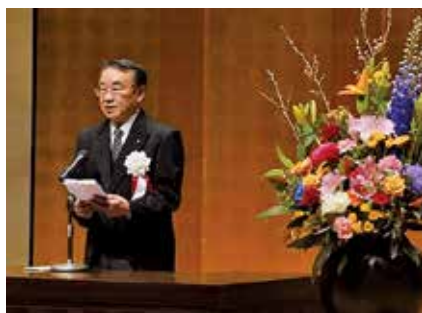
▲式辞を述べる議長

碧南市市制75周年記念式典が行われ、14名の市政功労者の方が表彰されました。碧南市議会を代表して、市長に続き議長が式辞を述べました。